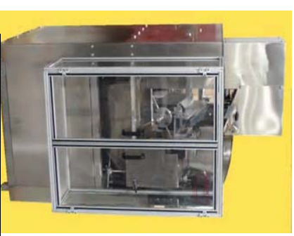
Modelo Compacto P-2-H. 1.1m x 1.1m area de piso, incluyendo una tolva y elevar de 2.1m cúbicos!