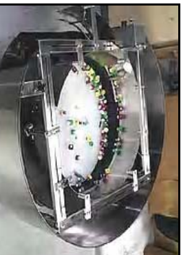
Tapas deportivas ensamblados a una velocidad de 700 por minuto para una línea de ensamble..