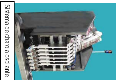
Sistema de charola oscilante

Adecuado para alimentos, medicinas, cosméticos, farmacéutico, dulces, condimentos, herramienta y componentes eléctricos!