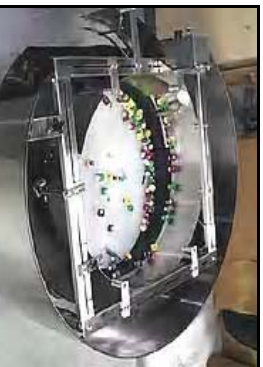
Tapas deportivas ensamblados a una velocidad de 700 por minuto para una línea de ensamble..