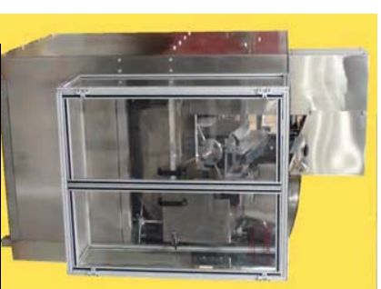
Modelo Compacto P-2-H. 1.1m x 1.1m area de piso, incluyendo una tolva y elevar de 2.1m cúbicos!