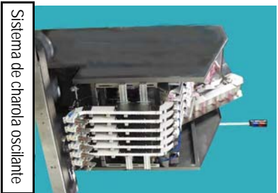
Sistema de charola oscilante

Adecuado para alimentos, medicinas, cosméticos, farmacéutico, dulces, condimentos, herramienta y componentes eléctricos!